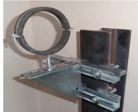
Montage einer Auflegerkonsole