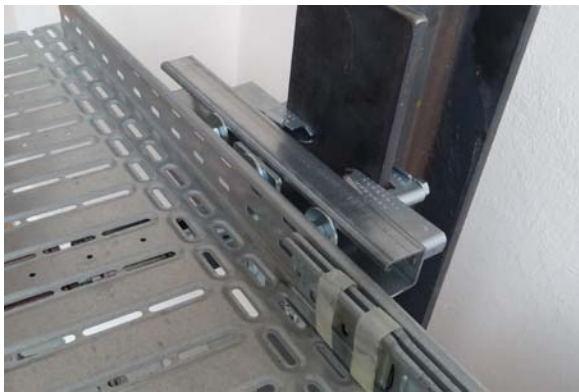
Schnelle Befestigung einer Kabelrinne