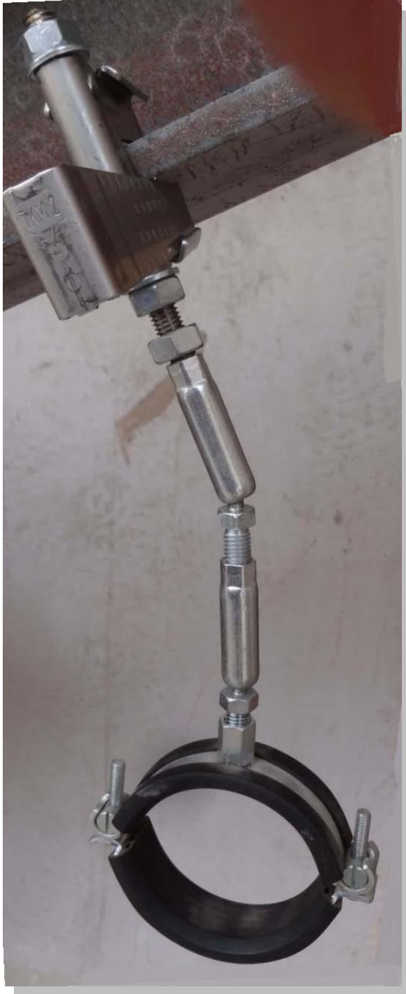
Rohrbefestigung am ansteigenden Stahlträger hier z. B. bis 30° Grad