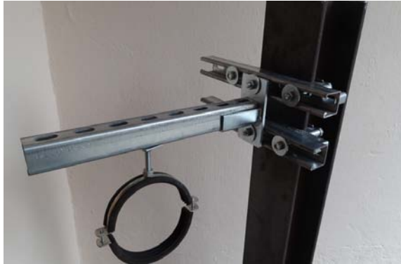
Auslegerarm für Rohre , etc.