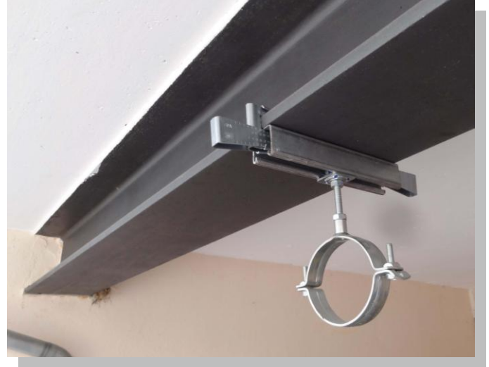
Systembefestigung massiv, VdS und FM konform